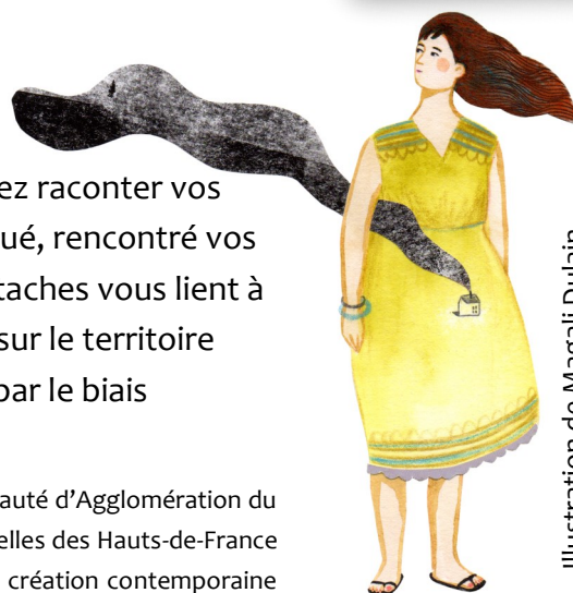
Illustration de Magali Dulain