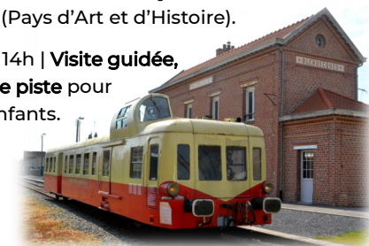
La gare de Blendecques restaurée

sam. 14h | Visite guidée, jeu de piste pour les enfants.