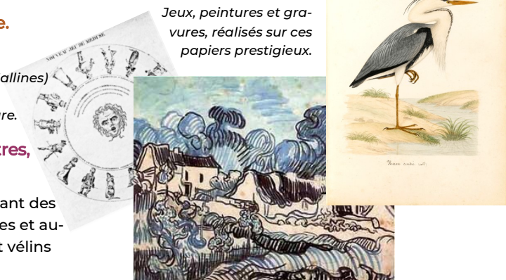
Jeux, peintures et gravures, réalisés sur ces papiers prestigieux.

Le moulin Pidoux fait partie des derniers moulins fabriquant des papiers à la forme en France : découvrez les grands artistes et auteurs dont les œuvres ont été imprimées sur les vergés et vélins des Dambricourt d'Hallines.